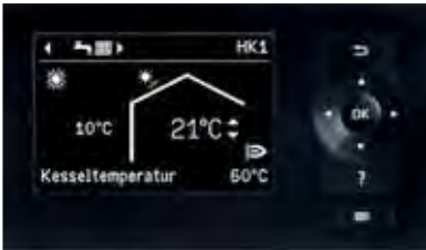
Display der Vitotronic Regelung mit Klartextanzeige und übersichtlicher Menüführung