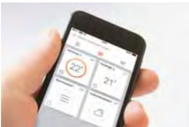
Mit Vitoconnect und einem Smartphone ist die Bedienung von Viessmann Heizungsanlagen ein Kinderspiel.