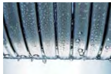
Inox-Radial-Wärmetauscher – langlebig und effizient

bundheizfläche wird die eingesetzte Energie praktisch verlustfrei und effizient bis zu 98 Prozent in Wärme umgewandelt. Dieser besonders sparsame Umgang mit wertvollem Heizöl hat auch weniger CO 2 -Emissionen zur Folge.