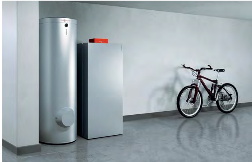
Gas-Brennwertkessel Vitocrossal 300 mit Warmwasserspeicher Vitocell (links)

Der Einsatz eines Brennwertkessels ist bei Neubauten schon fast selbstverständlich, da sich hier Heizkessel und Heizungsanlage von vornherein optimal aufeinander abstimmen lassen: Größten Nutzen bringt ein Brennwertkessel beim Einbau in Heizungsanlagen mit niedrigen Heizsystemtemperaturen. Selbst im Zuge einer Modernisierung lassen sich mittels Brennwerttechnik bis zu 30 Prozent der Heizkosten einsparen.