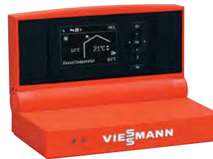
Vitotronic 200 Regelung mit übersichtlicher Menüführung